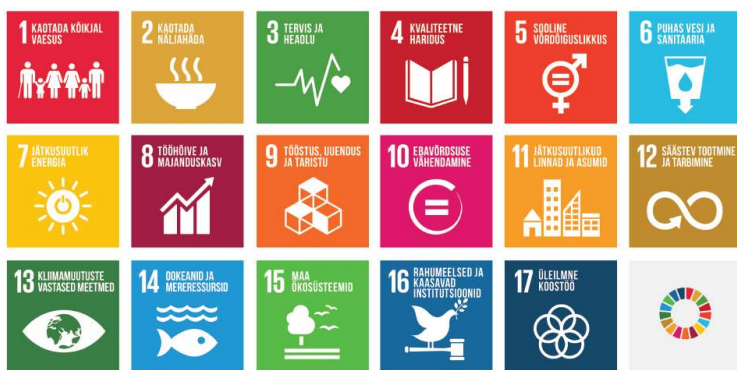
Joonis 1. ÜRO säästva arengu eesmärgid aastani 2030

Veel kümme aastat tagasi ei osatud Euroopa ega maailma tasemel hinnata identiteedihalduse tähtsust. Maailma globaliseerumine ning infoühiskondade teke ja areng on selle valdkonna toonud rambivalgusesse. Maailma arenguorganisatsioonid ja Euroopa Liit on identiteedihalduse kuulutanud üheks arenguprioriteediks.