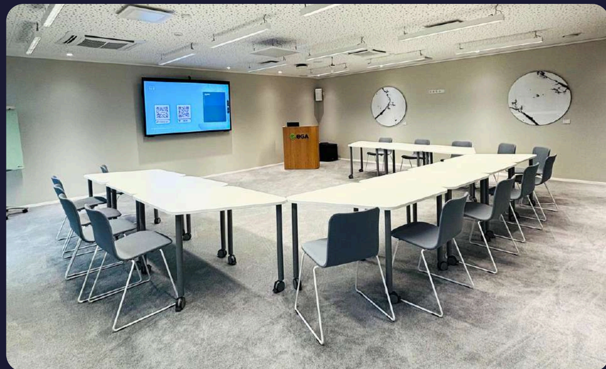
U-kujuliselt laudades 15-20 inimest