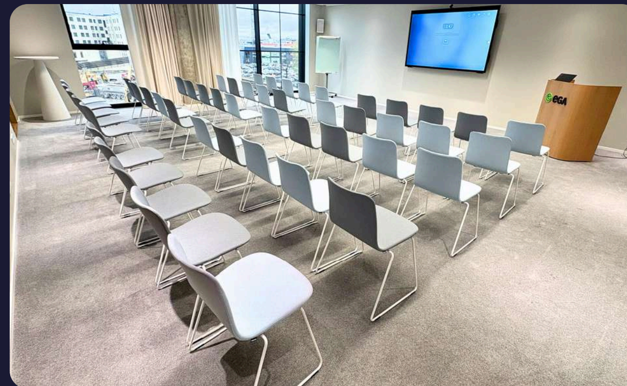
Teatristilis kuni 50 inimest