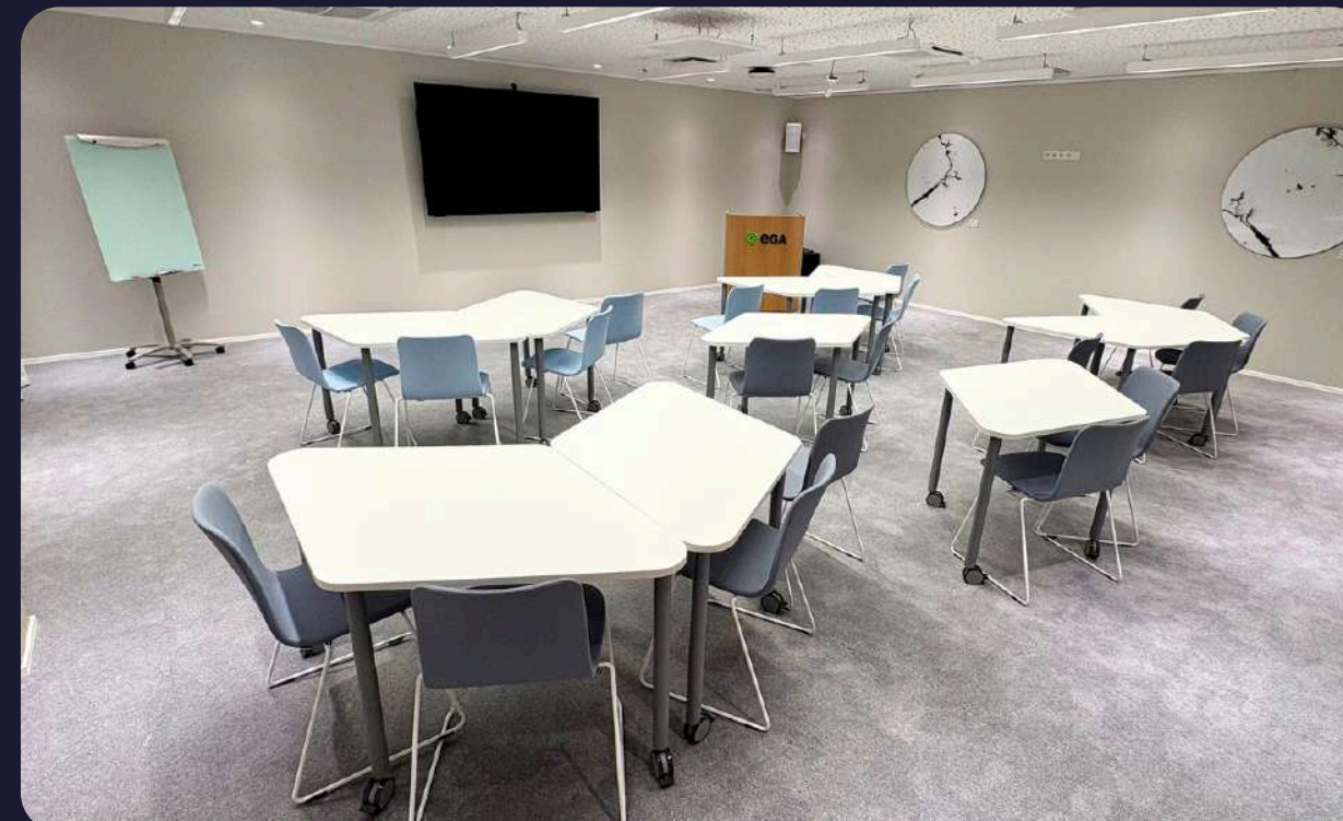
Laudades 20-30 inimest