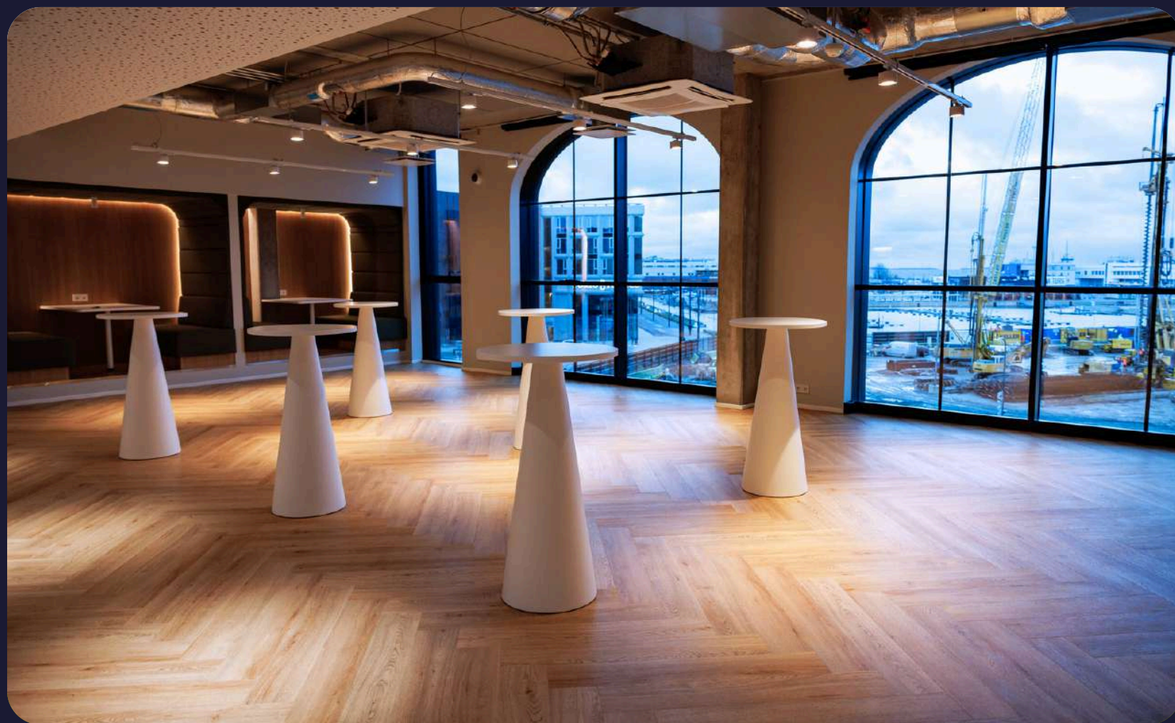
Sadama suunas avatud vaatega suhtlusala kuni 60 inimesele