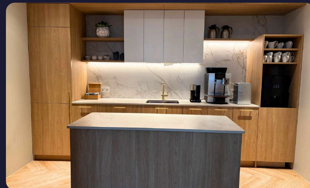
Terviklikult sisustatud kööginurk