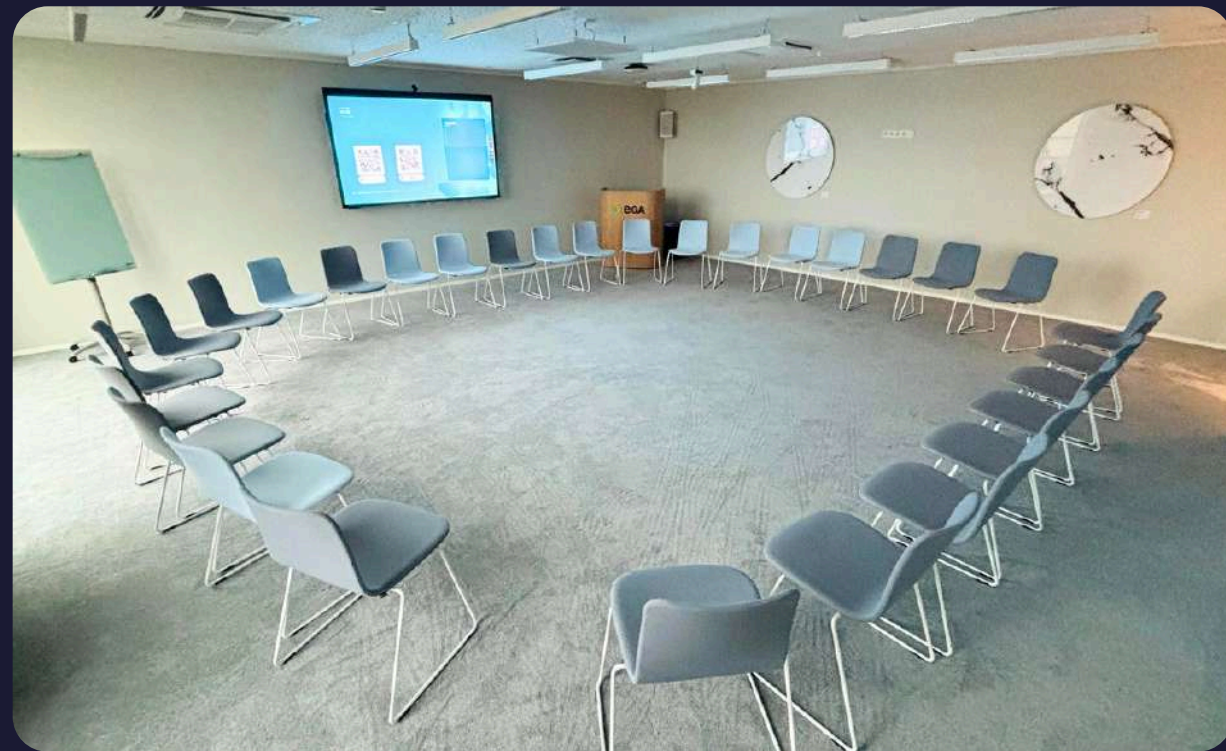
U-kujuliselt toolidega 20-25 inimest